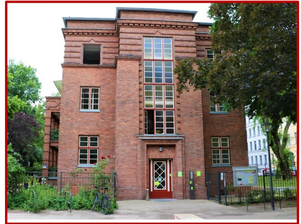
Adalbertstraße 23 A